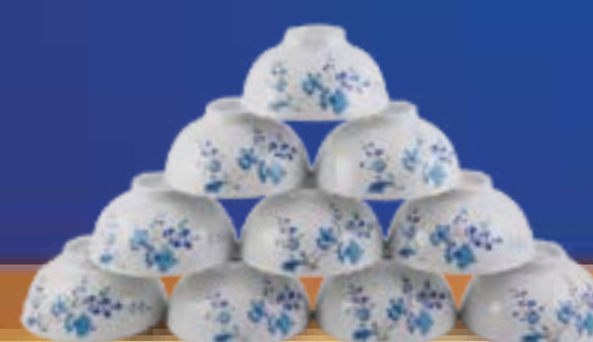
BAN MAI XANH