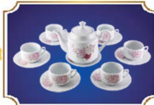
BỘ TRÀ TIỂU LỄ NHUNG NHẬT