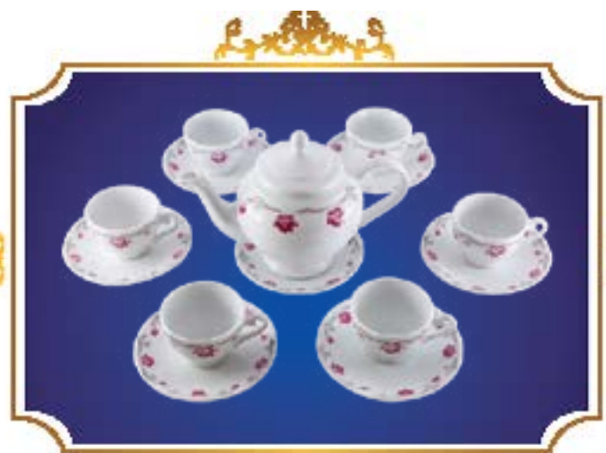
BỘ TRÀ CHUÔNG NGÂN VIỄN SEN