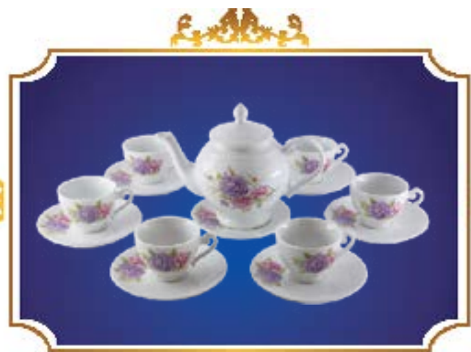
BỘ TRÀ CHUÔNG NGÂN Ý XUÂN