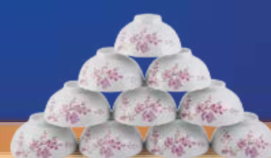
BAN MAI HỒNG