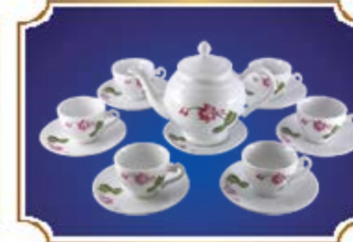
BỘ TRÀ CHUÔNG NGÂN HOA SEN