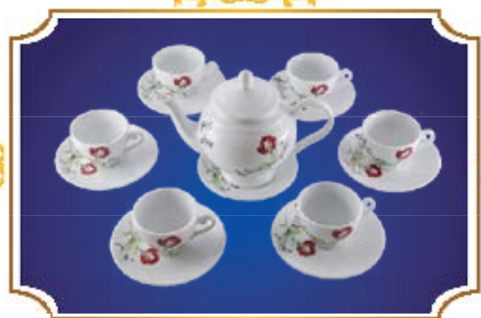
BỘ TRÀ CHUÔNG NGÂN NHẠC HỒNG