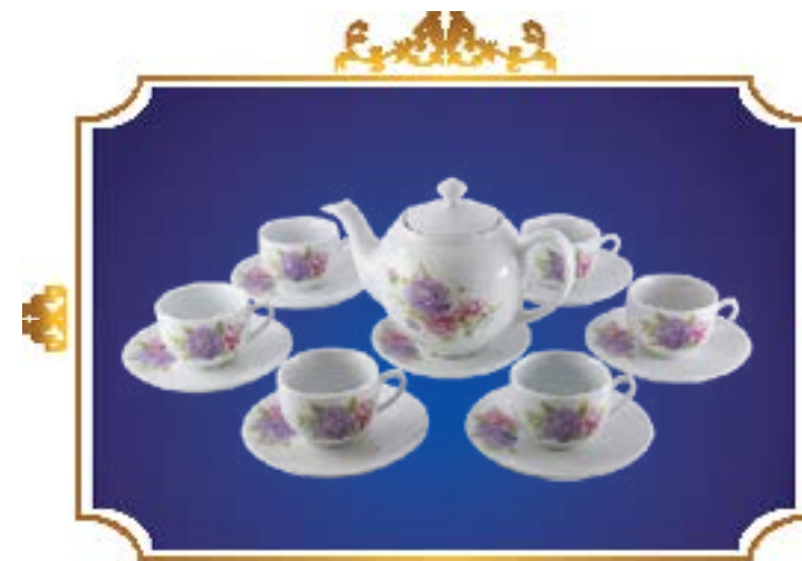
BỘ TRÀ BẦU THANH Ý XUÂN