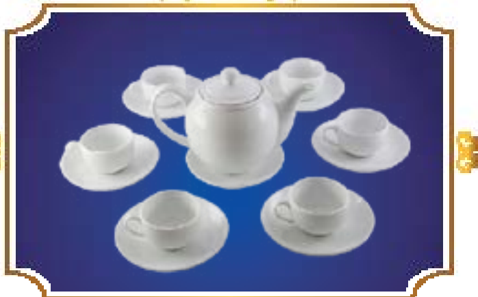
BỘ TRÀ BẦU THANH