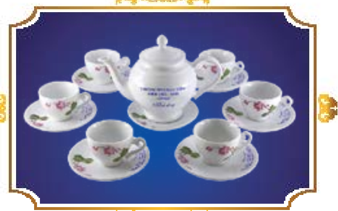
BỘ TRÀ CHUÔNG VÀNG HOA SEN IN CHỮ