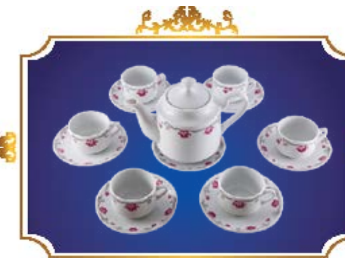
BỘ TRÀ TIỂU LỄ VIỄN SEN