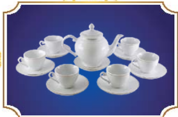
BỘ TRÀ CHUÔNG NGÂN VÀNG KIM