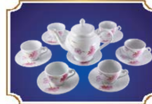
BỘ TRÀ CHUÔNG NGÂN LƯU LY