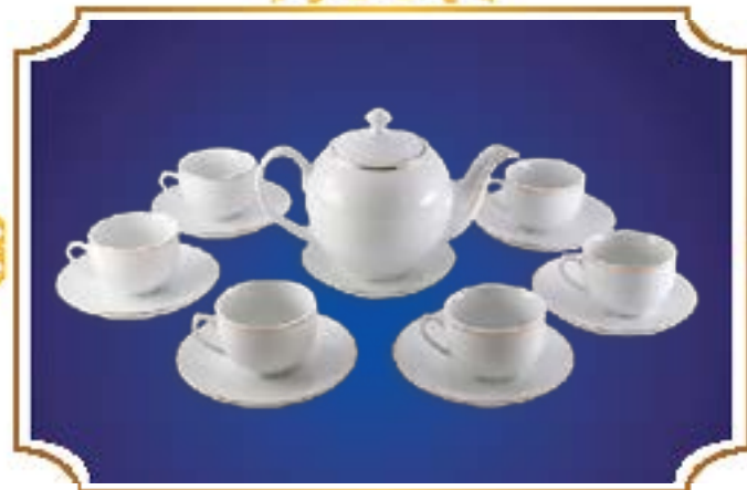
BỘ TRÀ BẦU THANH VÀNG KIM