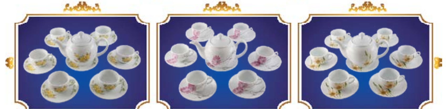
BỘ TRÀ BẦU THANH CÚC TRÚC