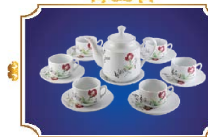
BỘ TRÀ TIỂU LỄ NHẠC HỒNG