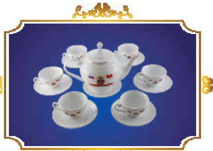
BỘ TRÀ CHUÔNG VÀNG VÀNG KIM IN CHỮ