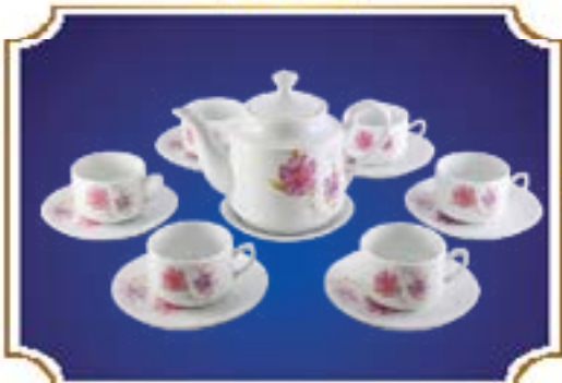
BỘ TRÀ TIỂU LỄ TỶ MỤI