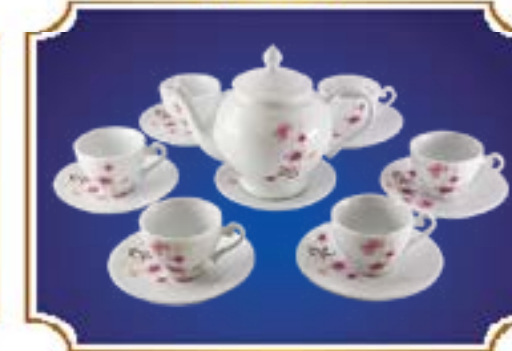
BỘ TRÀ CHUÔNG NGÂN ANH ĐÀO