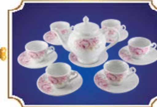
BỘ TRÀ CHUÔNG NGÂN HỒNG LY