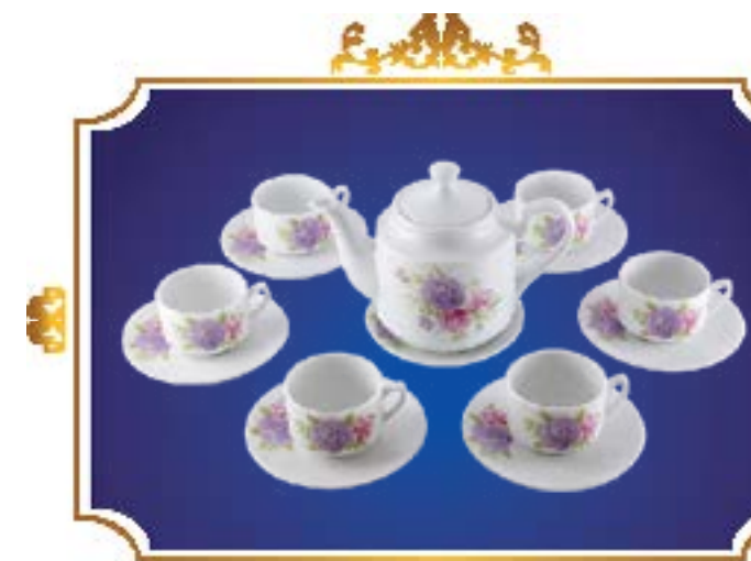
BỘ TRÀ TIỂU LỄ Ý XUÂN