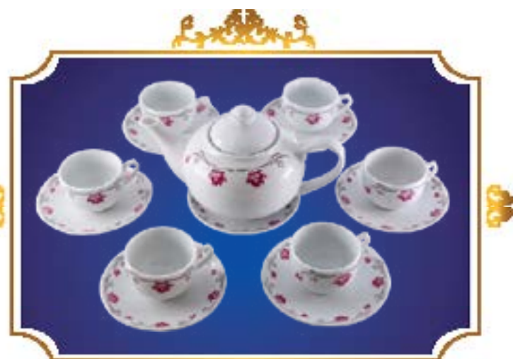
BỘ TRÀ BẦU VIÊN SEN