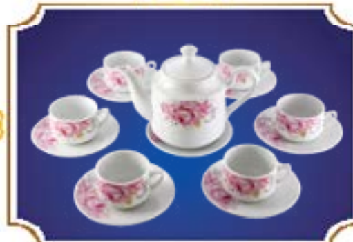
BỘ TRÀ TIỂU LỄ HỒNG LY