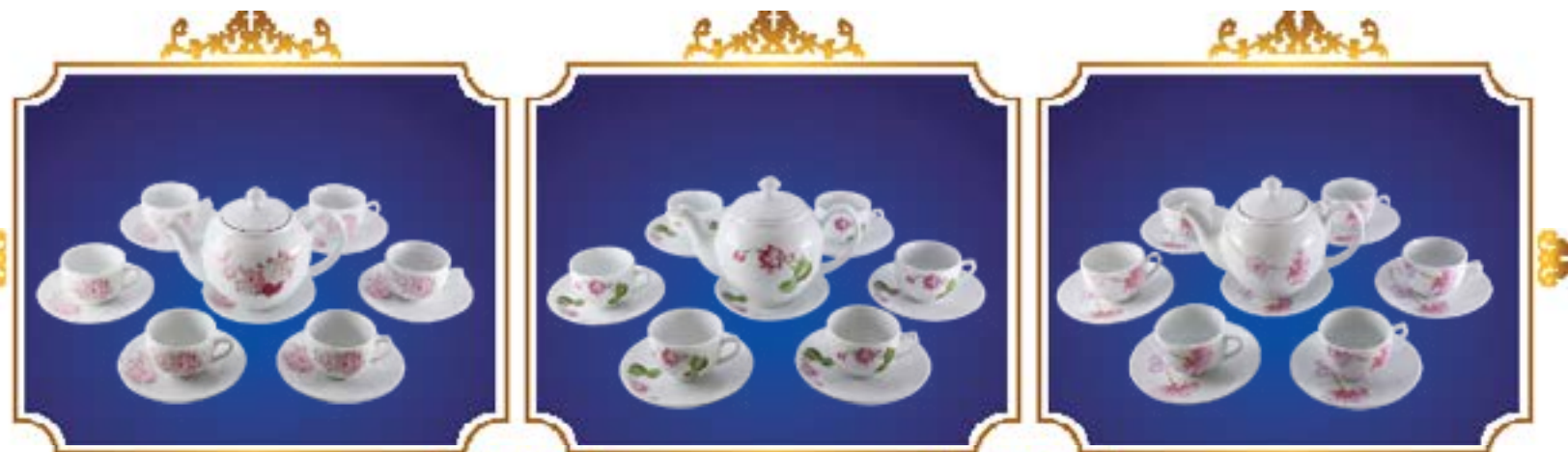
BỘ TRÀ BẦU THANH NHUNG NHẬT