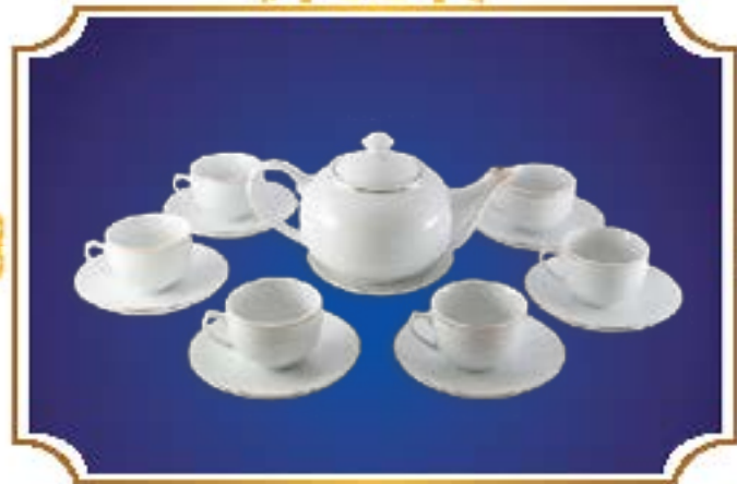
BỘ TRÀ BẦU VÀNG KIM