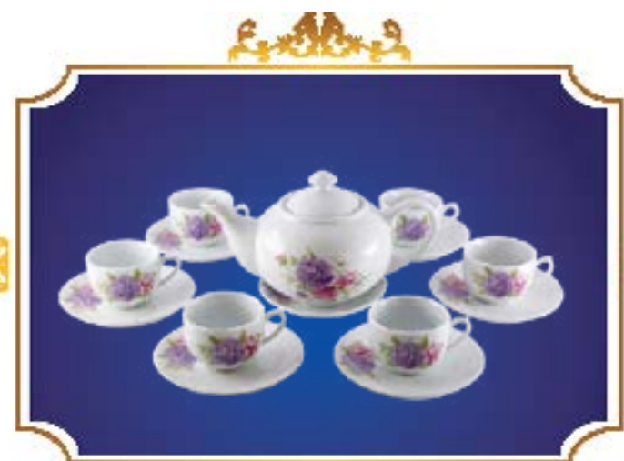
BỘ TRÀ BẦU Ý XUÂN