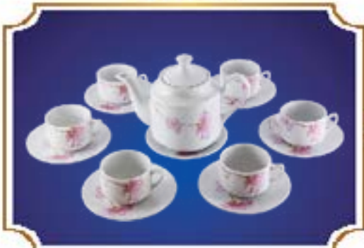
BỘ TRÀ TIỂU LỄ LƯU LY