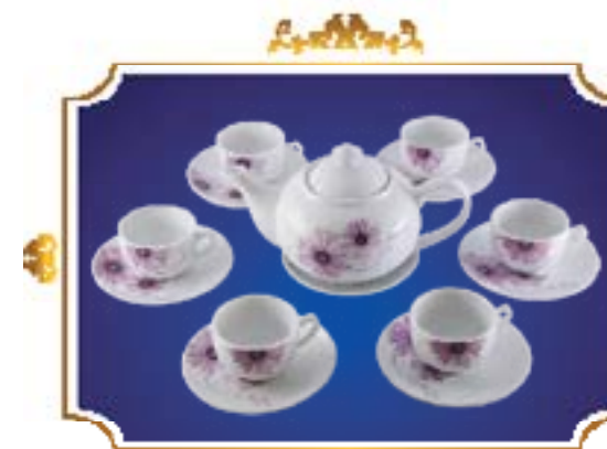
BỘ TRÀ BẦU CÚC TÍM