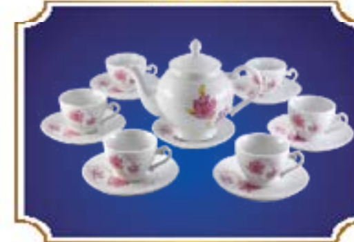
BỘ TRÀ CHUÔNG NGÂN TỶ MỤI