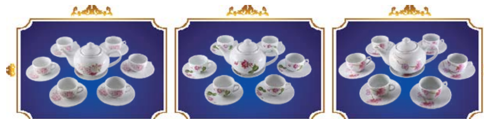
BỘ TRÀ BẦU NHUNG NHẬT