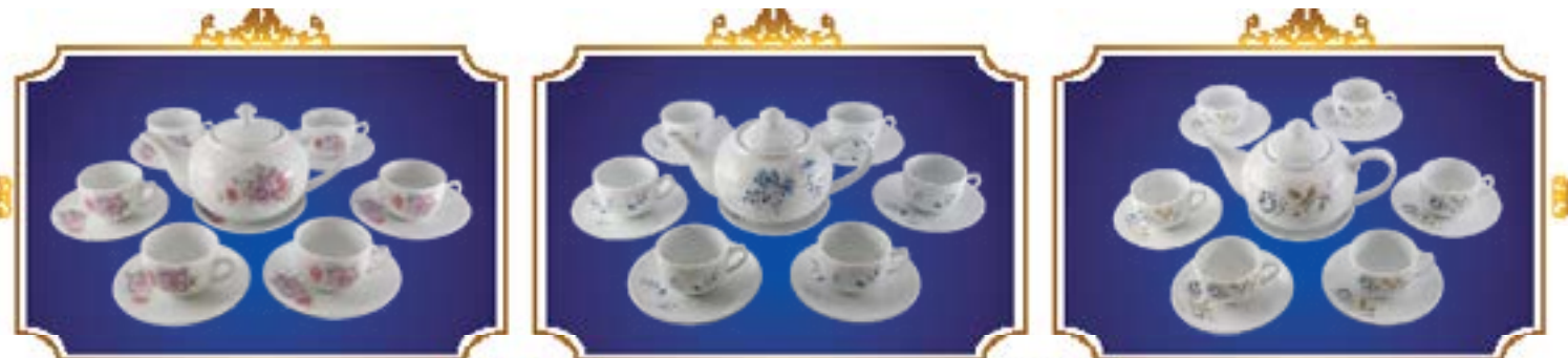
BỘ TRÀ BẦU HỒNG TÍM