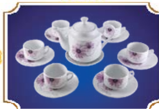
BỘ TRÀ TIỂU LỄ CÚC TÍM