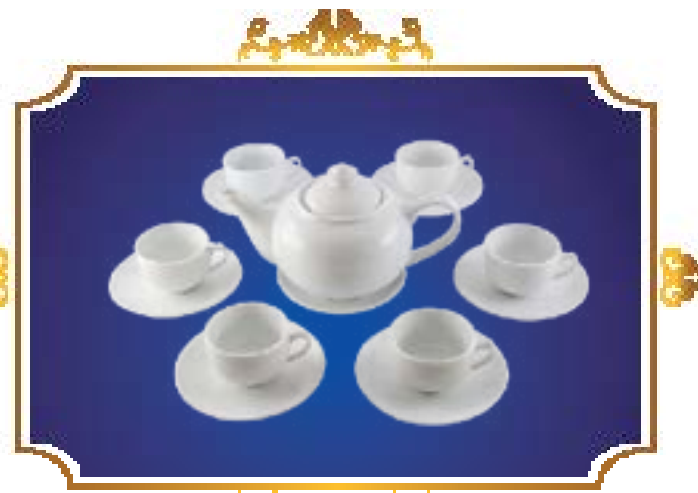
BỘ TRÀ BẦU TRẮNG