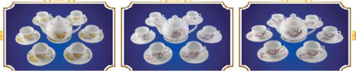
BỘ TRÀ BẦU CÚC TRÚC