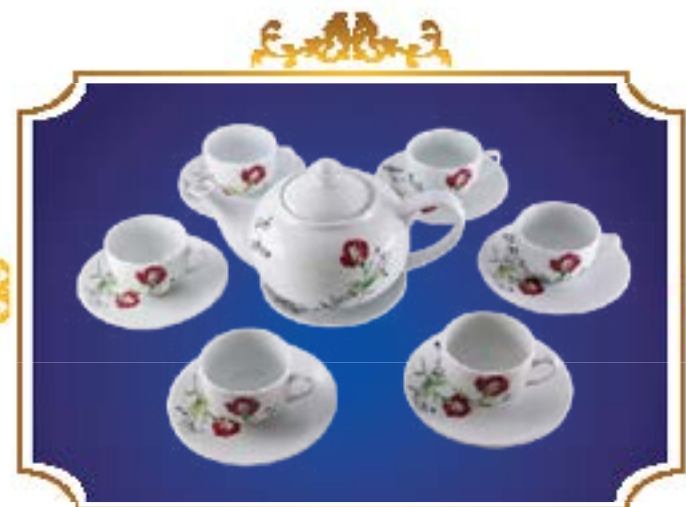
BỘ TRÀ BẦU NHẠC HỒNG