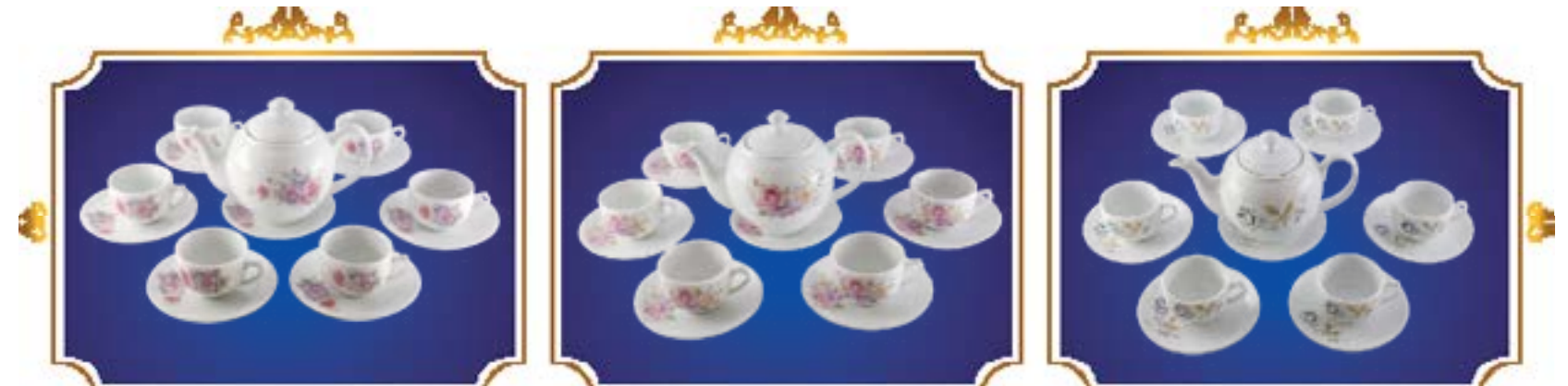
BỘ TRÀ BẦU THANH HỒNG TÍM