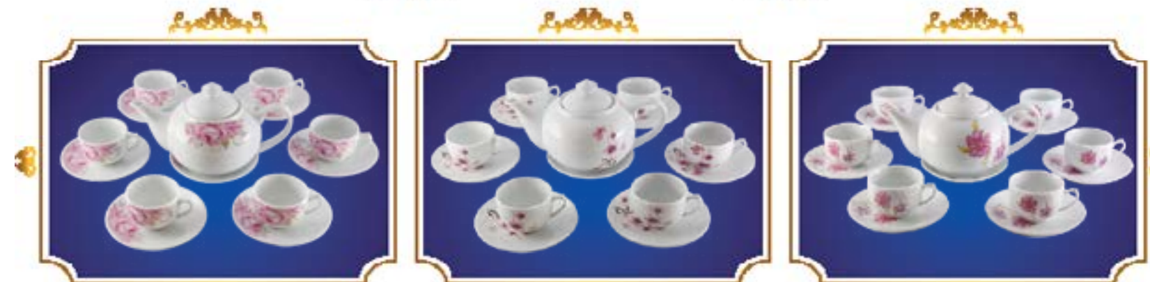
BỘ TRÀ BẦU HỒNG LY