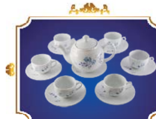
BỘ TRÀ BẦU THANH BAN MAI XANH