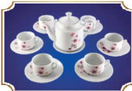
BỘ TRÀ TIỂU LỄ ANH ĐÀO