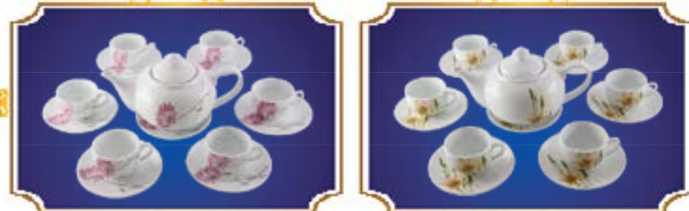
BỘ TRÀ BẦU ĐỒNG TIỀN