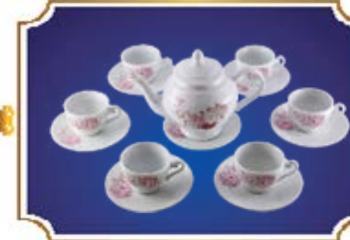
BỘ TRÀ CHUÔNG NGÂN NHUNG NHẬT