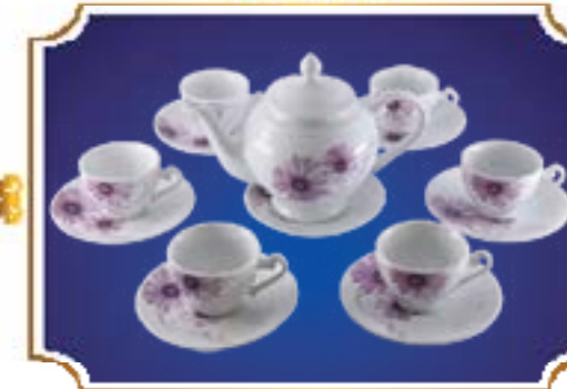
BỘ TRÀ CHUÔNG NGÂN CÚC TÍM