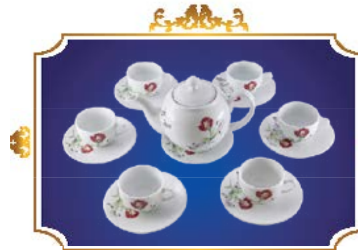
BỘ TRÀ BẦU THANH NHẠC HỒNG