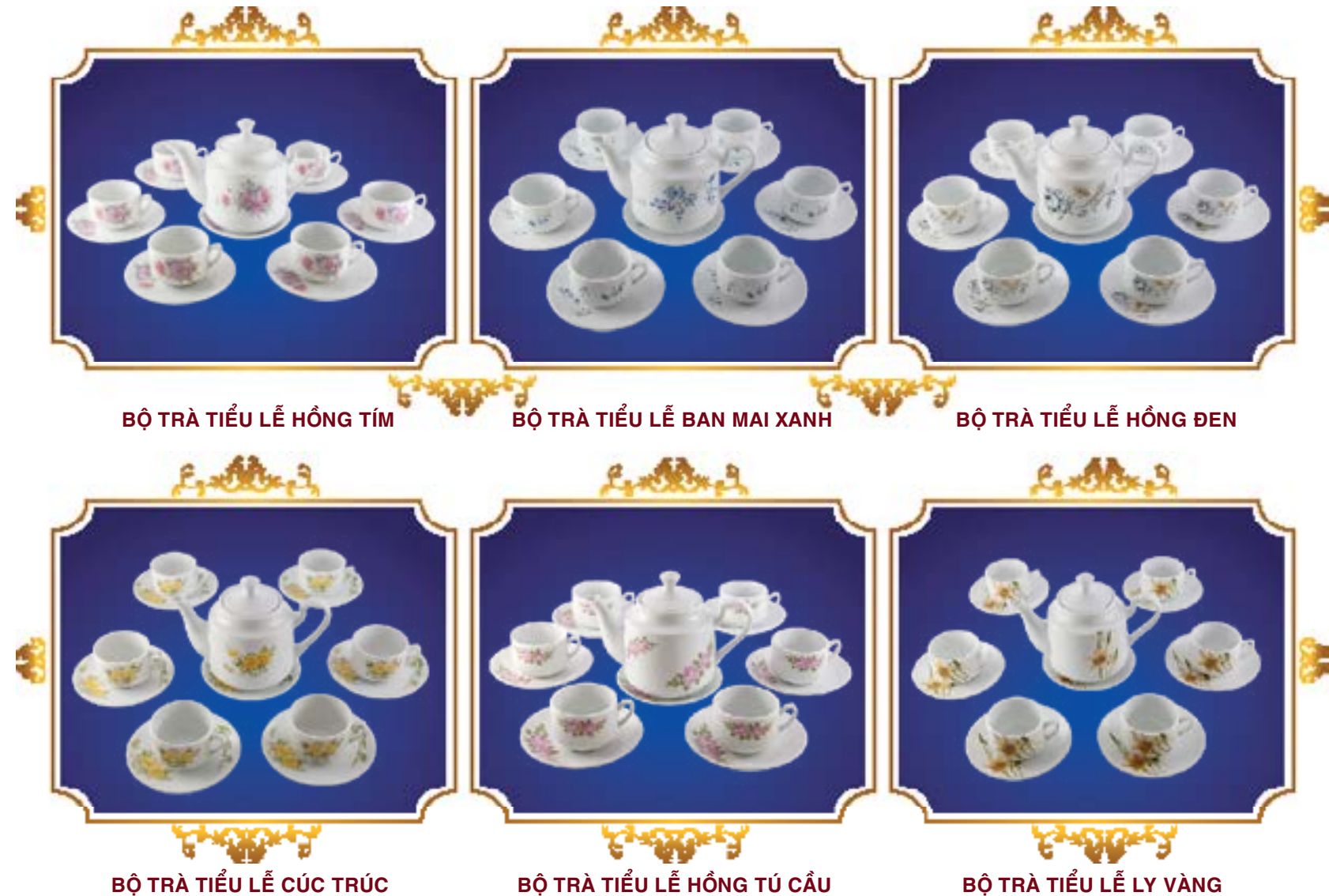
BỘ TRÀ TIỂU LỄ HỒNG TÍM