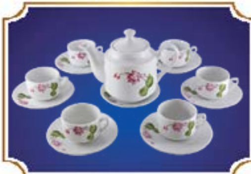
BỘ TRÀ TIỂU LỄ HOA SEN