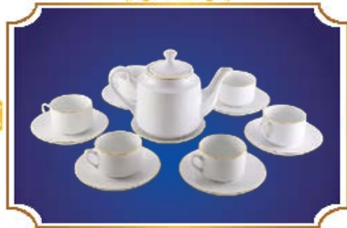
BỘ TRÀ TIỂU LỄ VÀNG KIM