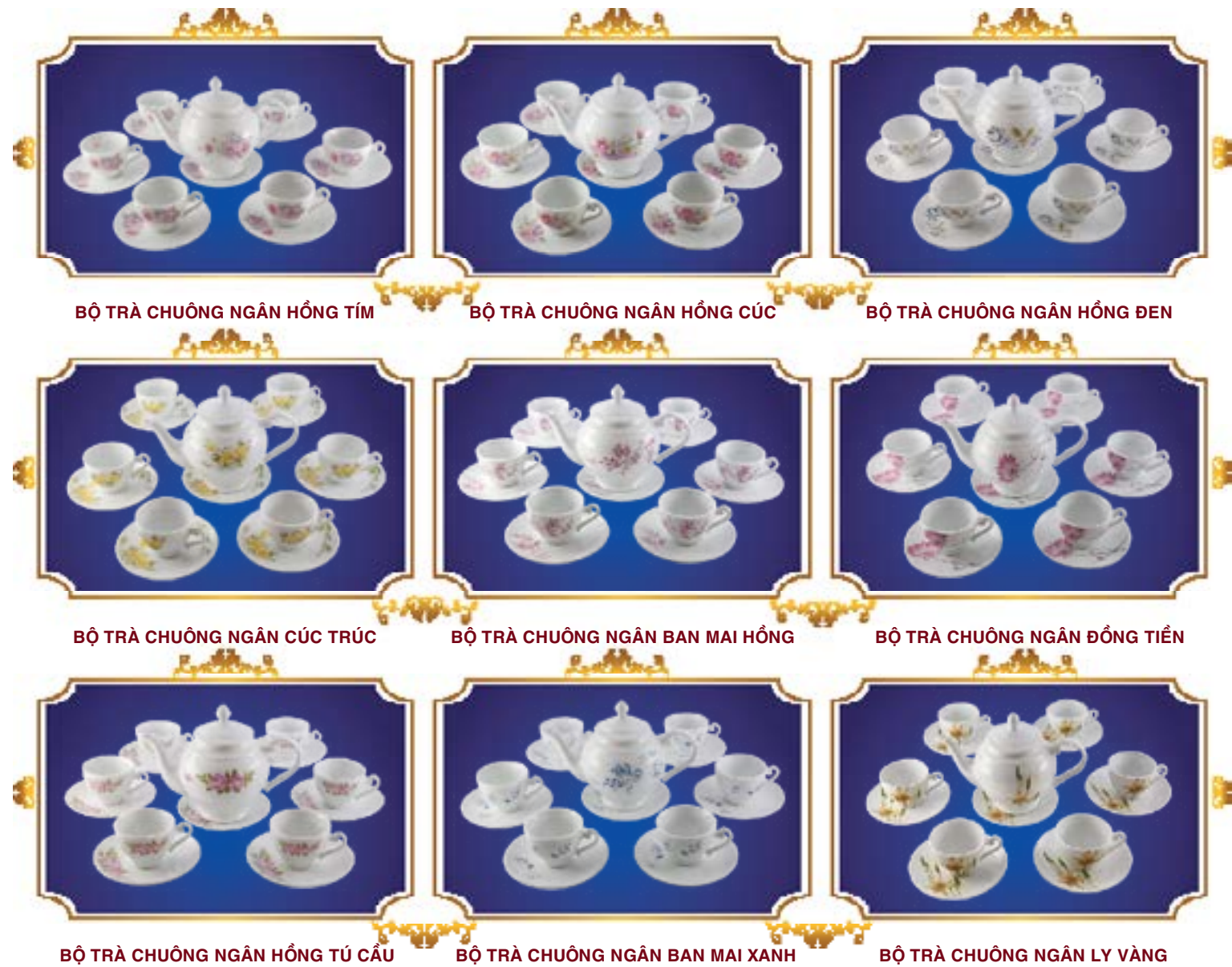
BỘ TRÀ CHUÔNG NGÂN HỒNG TÍM