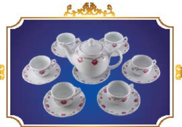
BỘ TRÀ BẦU THANH VIÊN SEN